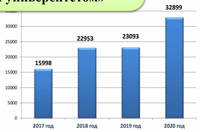
Рисунок 1. Численность обучающихся с РАС в Российской Федерации