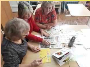
Сводные данные детей, посещающих НКО «Безграничные возможности»